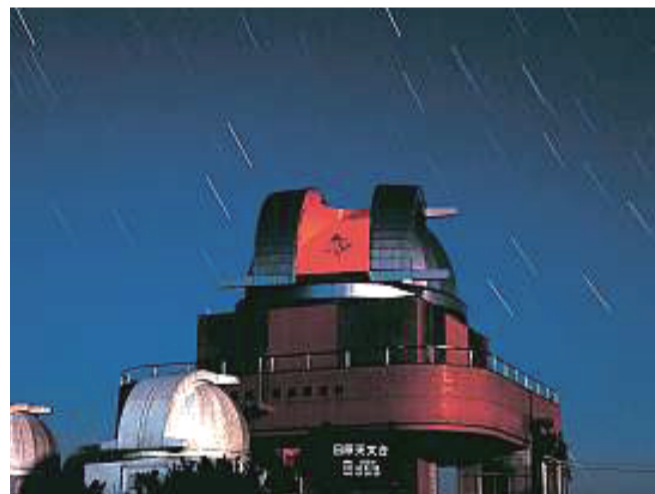
日原天文台と満天の星空