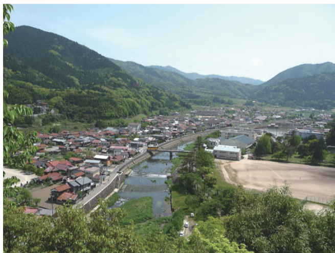
太鼓谷稲荷から津和野の町を望む

委員会の皆様の努力と職員の皆様の協力あり、今現在褥瘡の方はゼロ。スキントラブルも今目立った問題はないとのことでした。そして本日は委員会主催の「排泄ケア研修会」です。