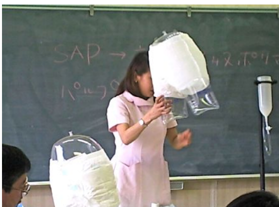
ある在宅介護教室にてオンリーワンパンツの紹介

オンリーワンパンツが光洋新商品として業務用で販売されてから約10ヶ月、おかげさまで販売直後からかなりの反響を頂いています。宅配サービスでご注文をいただいたお客様からは、どんな紙パンツも嫌がってはいってくれなかったけれどこのパンツを試してみたら嫌がらずとても助かったというお礼のお電話を頂きました。自己脱衣行為がなくなったという精神病院さんからの感想もあります。また、私が現場に入った施設さんでは、日中紙パンツで過ごして夜紙おむつに替えるというご利用者様に、夜も夜間用パッド(光洋オンリーワンエアープラスXL・36×70cm・1000cc)を入れてこのパンツで寝ていただいたところ、非常に効果があり、夜おむつに替える手間の軽減とコストの削減になったと喜ばれました。それだけではありません、やはり誰でもおむつというものは抵抗があるものです。出来ればおむつなんて使いたくない筈です。そういったお年寄りの満足と尊厳のためにもこの『オンリーワンパンツ』は選ばれるべき商品だと、自信を持ってお勧めします。