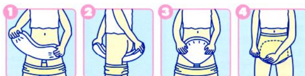
パッドの装着方法: たて折にして前から装着してください