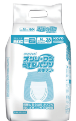
製品名:ディスパースオンリーワンパンツ前後フリー 吸収目安:2回 入数:156枚(26枚×6袋)