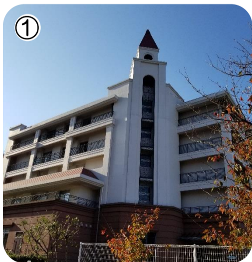
① 施設外観写真 法人敷地内は、きれいな洋館が建ち並びます。

病識、陰部洗浄の必要性など知識の再確認をおこなう。膀胱留置カテーテルの管理方法を知ってもらうためバルーンチューブの仕組みや、逆流の様子を実験式に実際目で見てもらう。陰部洗浄は、誰もが同じように実行できるよう、見本となる動画を作成。そして陰部洗浄の手技確認として、マンツーマンで他の人の行っているケアを見る・見せる時間をつくるようにし、できていない点があればその場で伝達をおこない、お互いの技術確認、疑問や改良点など話し合う。その手技確認は敢えて事前に予定せず、“1ヶ月の中でほんの10分” スタッフ自身が自主的に計画をたてて実行されました。