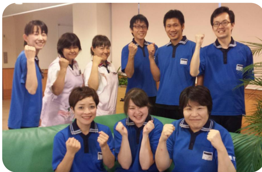
ご利用者の快適を求めて、スタッフみんなで頑張ります!!

このことから、昨年度の尿路感染症発生率は前年の5分3の減少に繋がりました。今では、誤嚥性肺炎の減少・白癬予防ケアなど、難しい取り組みも皆楽しみながら取り組んでいます。