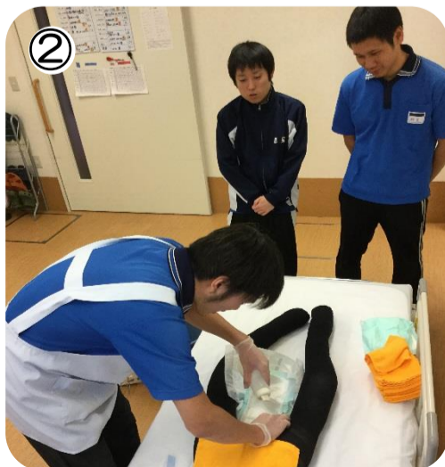
② お互いの技術を確認するため、陰部洗浄実技指導の実施