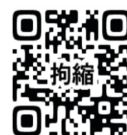
拘縮のある方のあて方